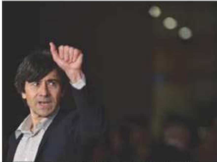
Luigi Lo Cascio, è stato al Piccolo Festival delle Arti de La Scaletta

«Quest'anno è stato difficile. Anche se non sono in grado di valutare quanto abbiano influito i problemi con il tax credit, c'è stata sofferenza anche per produzioni che facevano diversi film all'anno e questo le ha costrette a stare ferme. Sembra che qualcosa debba cambiare ma ancora non è stato messo a punto. Dal punto di vista produttivo i grandi come la Rai restano; quello che cambia è che