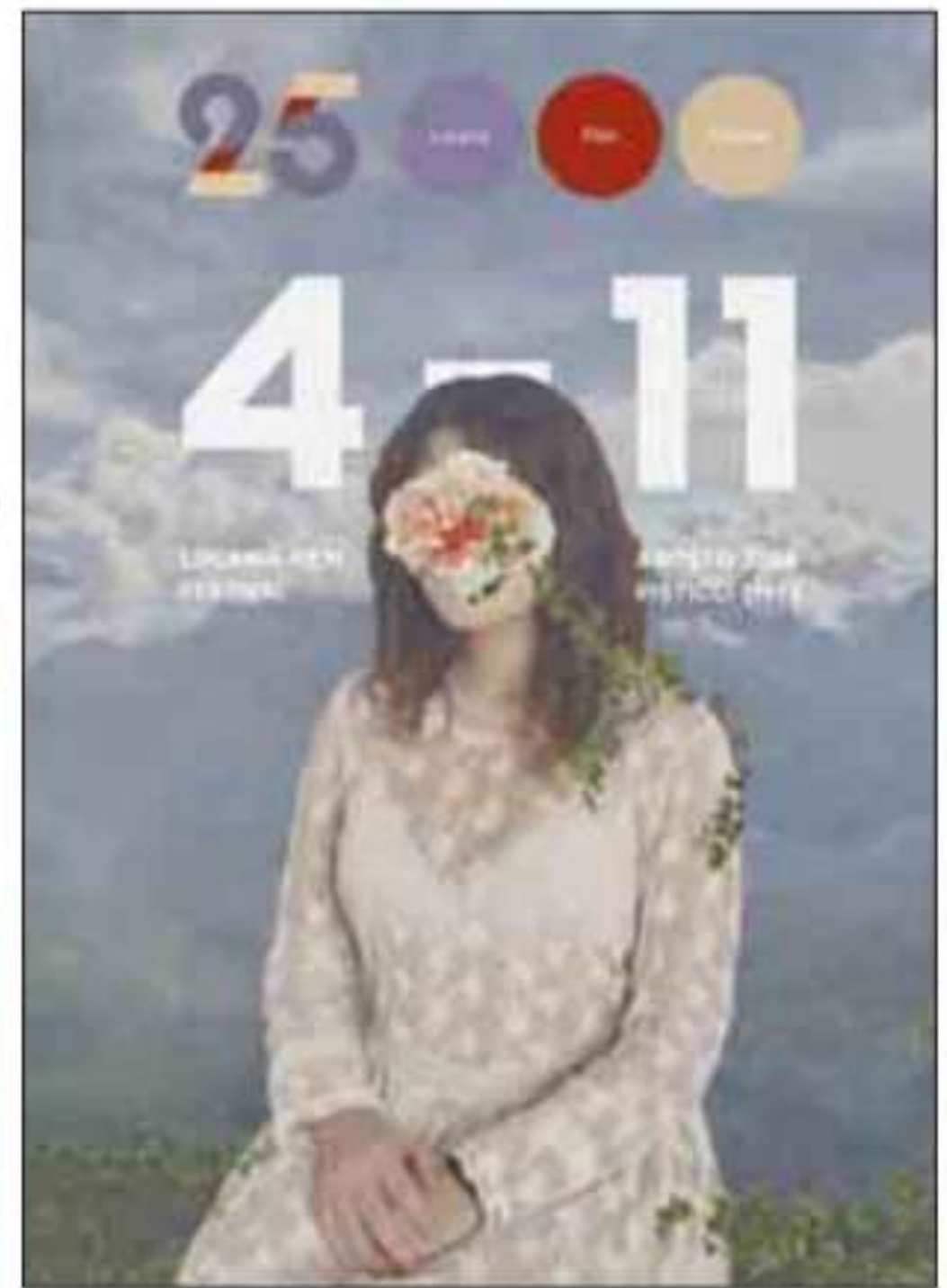
La locandina del Lucania Film Festival 2024

l'anno grazie ad attività di formazione ed eventi di promozione transdisciplinare che coinvolgono cinema e arti. Senza dimenticare il ruolo cruciale che il festival svolge nella