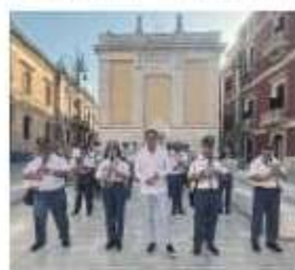
IN VIAGGIO Beppe Convertini

visitare la cattedrale di Otranto, Santa Maria Annunziata con il mosaico che raffigura alcune scene dell'Antico Testamento, uno dei più belli al mondo realizzato nel XII secolo da Pantaleone e dai suoi discepoli con la facciata risalente al Medioevo impreziosita da un rosone a sedici raggi».