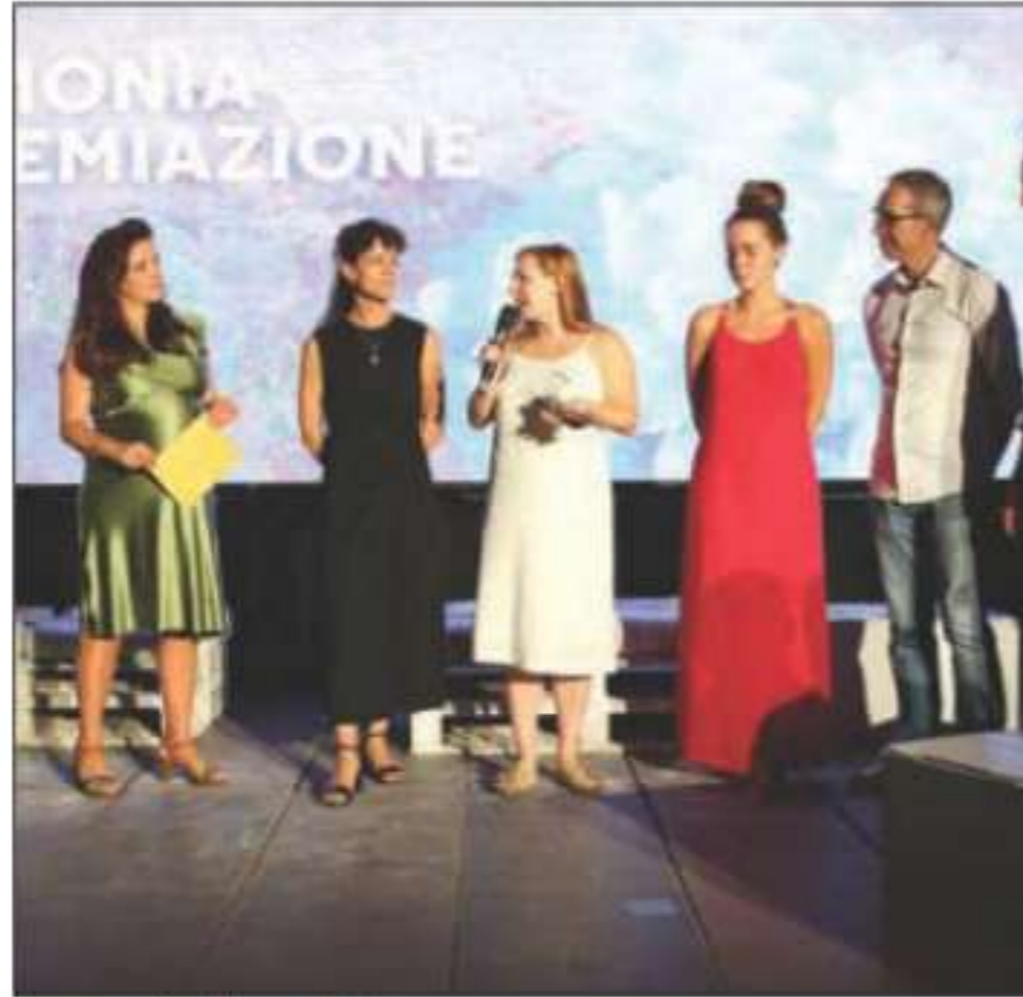
Un momento della premiazione

«Una edizione che ha suggellato quanto sia necessaria la determinazione nel realizzare progetti apparentemente faticosi, com-